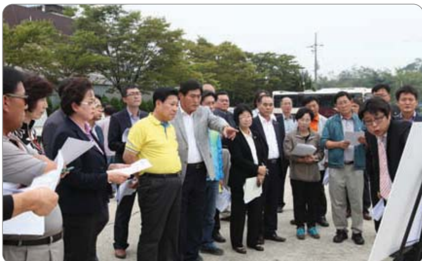
<< 면천 시립박물관 진입로 현장방문