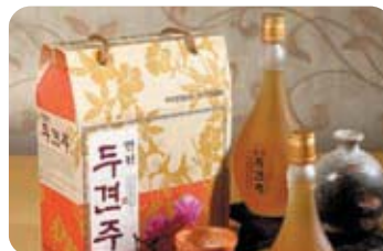
제5미 면천두견주 Dugyeon Liquor of Myeoncheon 천년을 이어온 명주의 맛