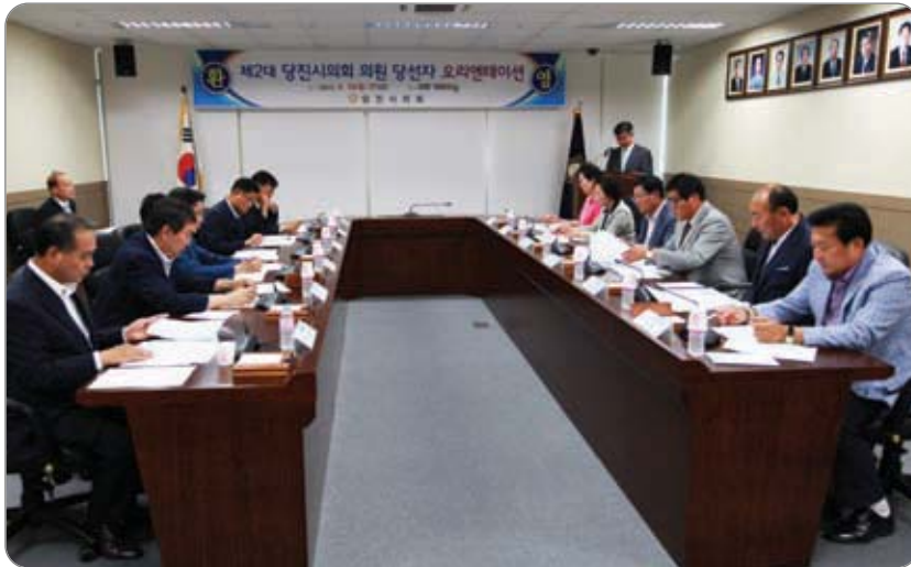
<<< 제2대 의원 당선자 오리엔테이션