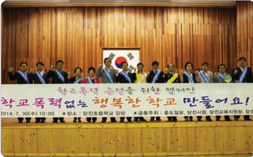
<<< 학교폭력 근절 캠페인