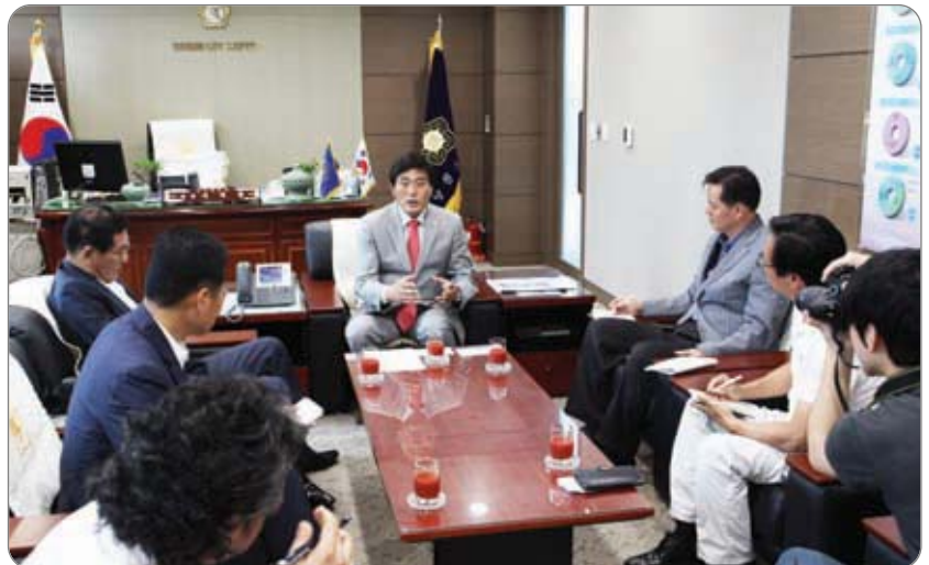
전국지역신문협회 대전충남협의회 인터뷰 >>>