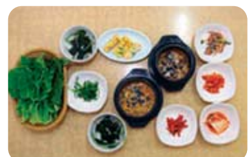
제9미 우렁쌈밥 Ureong ssambab 영양만점 맛도 최고