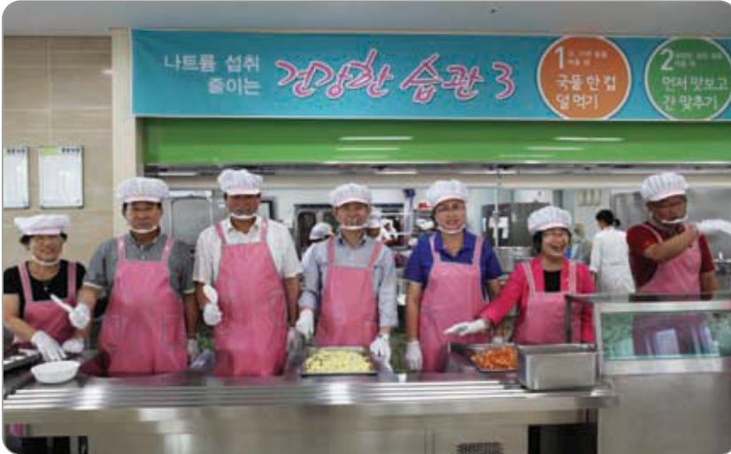
<<< 노인복지관 급식 봉사