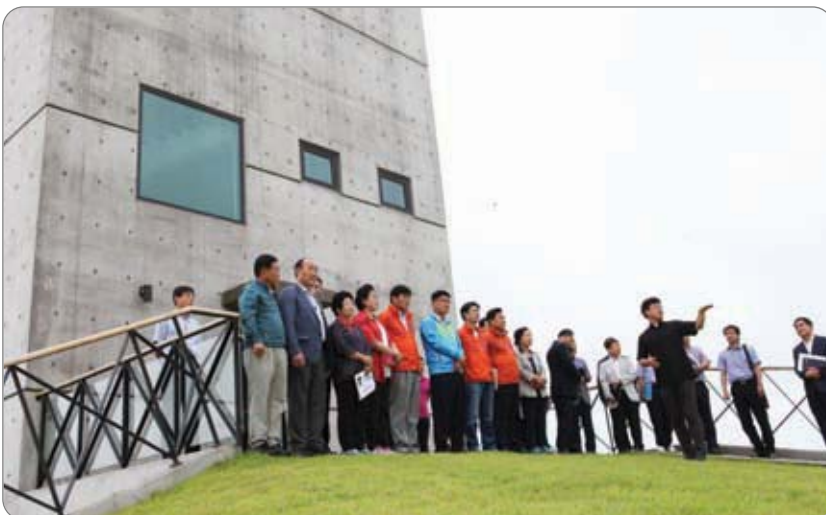
<<< 신리성지 현장방문(프란치스코 교황 방문지)