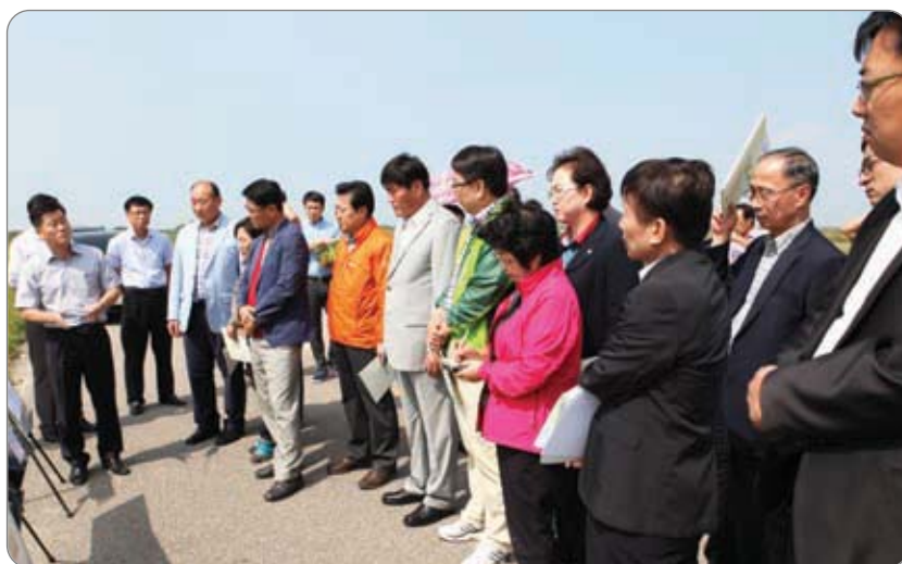
승산 낙협 육성우 전문목장 예정지 현장방문 >>>