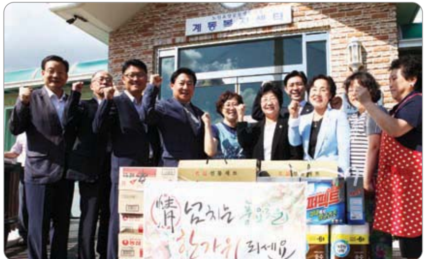
총무위원회 계동복지센터 위문 >>>