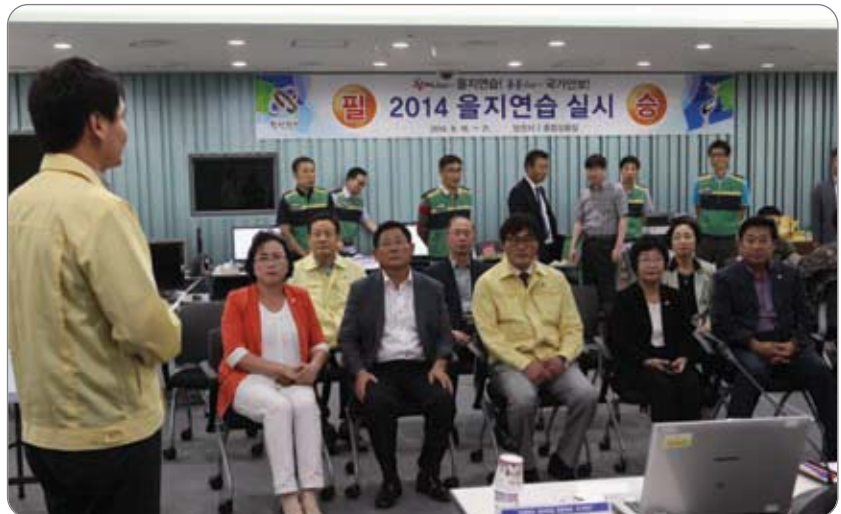
2014 을지연습 종합상황 청취 >>>