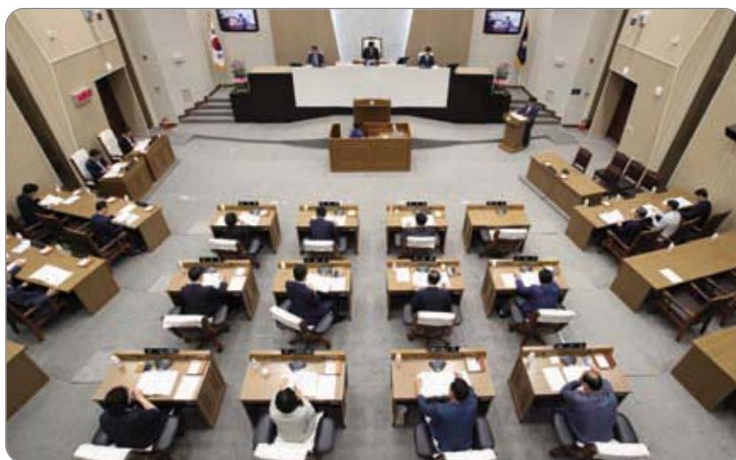
2014년도 시정 주요업무 추진상황 보고 청취 >>>