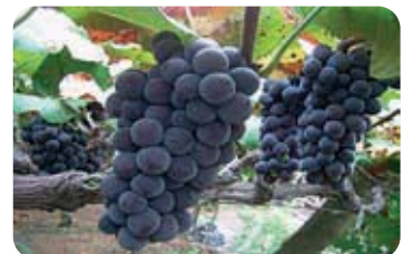
제6미 가화포도 Gahwa Grape 높은 당도와 진한 향