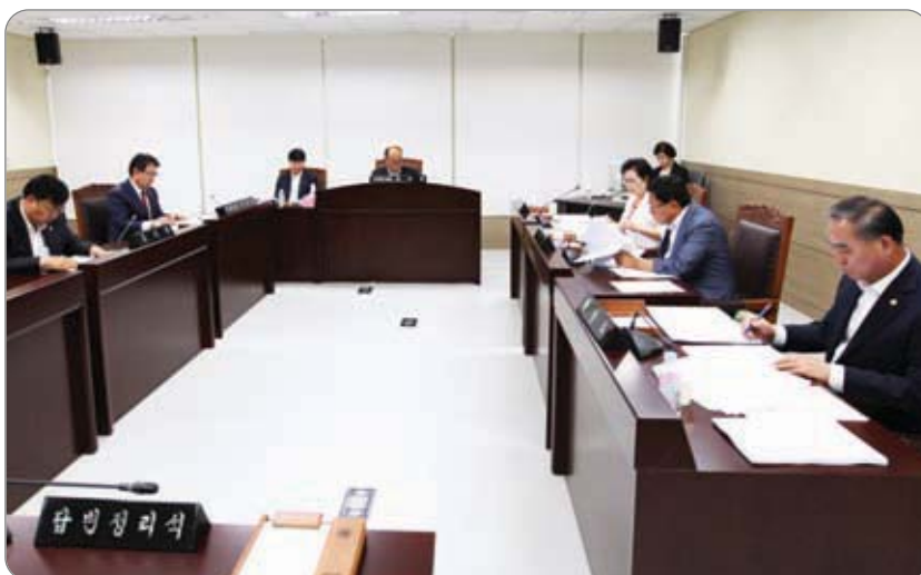
<<< 산업건설위원회 소관 조례안 심의