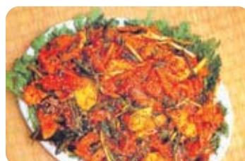
제8미 간재미회 Ganjaemi Young Ray Sashimi 100% 자연산으로 새콤달콤 회무침