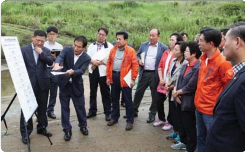
<<< 고대부곡지구 폐기물매립시설 현장방문