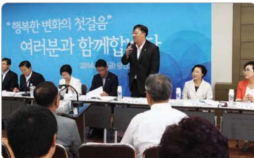
<<< 당진3동 초도 순방