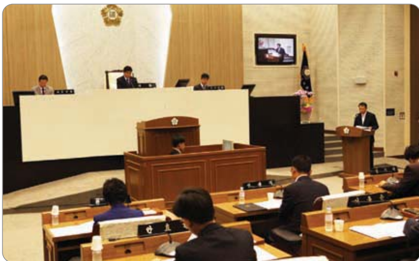
<<< 2014년도 제1차 정례회