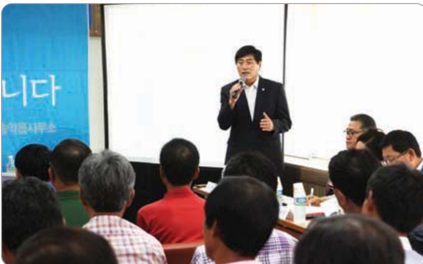
<<< 송악읍 초도 순방