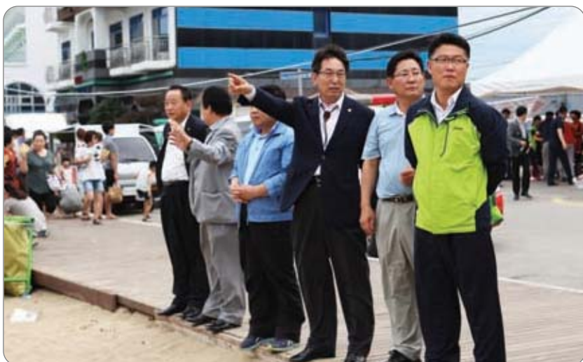
<< 해외달의 만남 당진 사랑 바다불꽃 축제