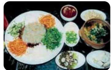
제3미 실치회 Shilchi Whitebait Sashimi 당진지역만의 특별한 맛