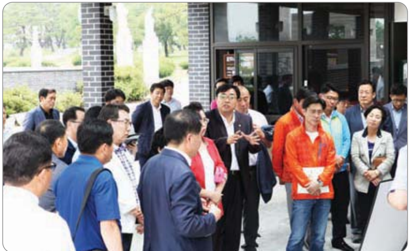
솔외성지 현장방문(프란치스코 교황 방문지) >>>