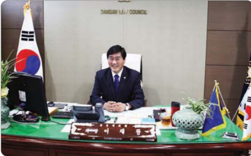
<<< 이재광 당진시의회 의장 집무실