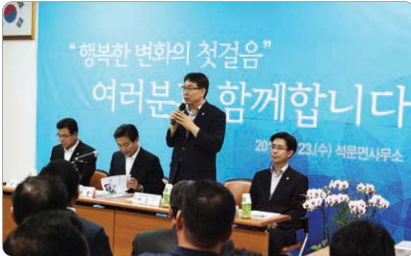
<<< 석문면 초도 순방