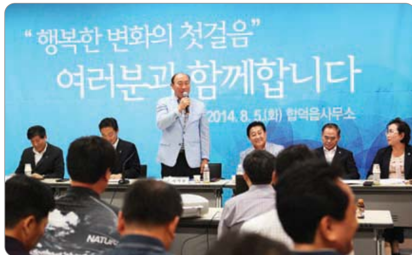
합덕읍 초도 순방 >>>