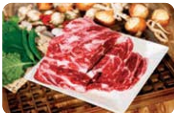
제4미 해나루한우 Haenaru Hanwool (beef) 1등급 이상의 고급육