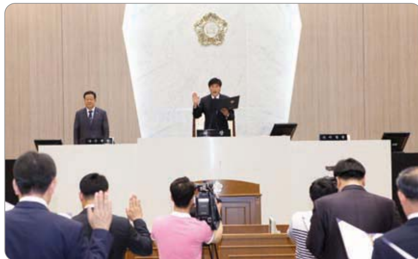
제2대 당진시의회 당선자 선서 >>>