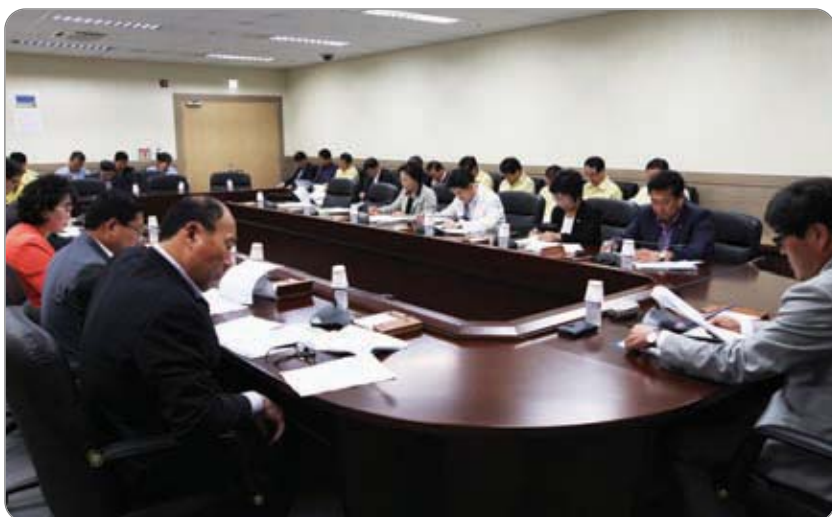
<<< 의원 출무일 운영