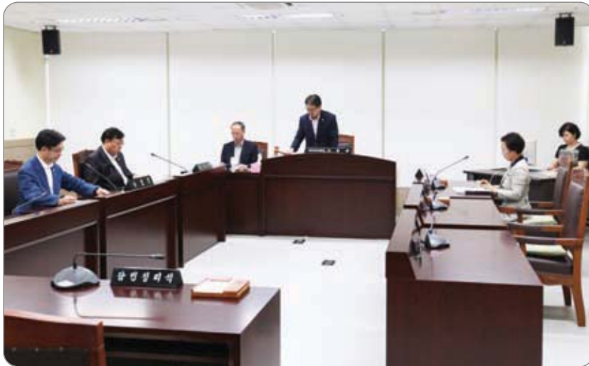
<<< 의회운영위원회 임시회 의사일정 협의