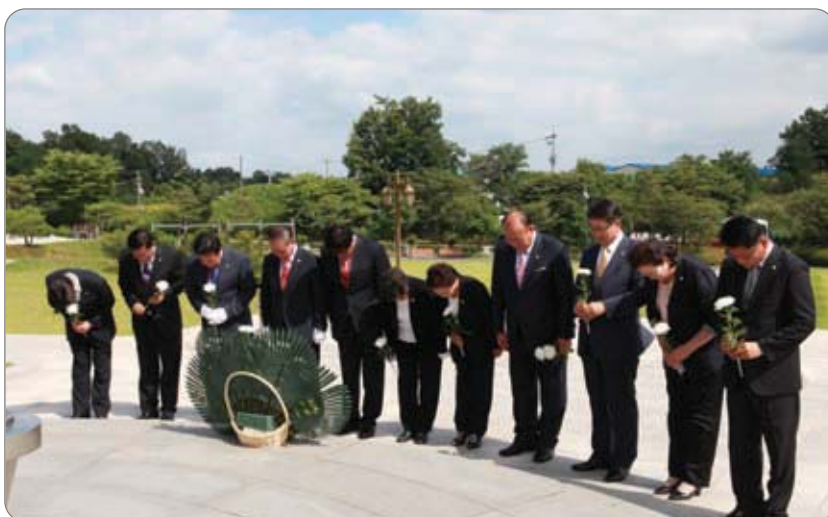
<<< 나라사랑공원 참배