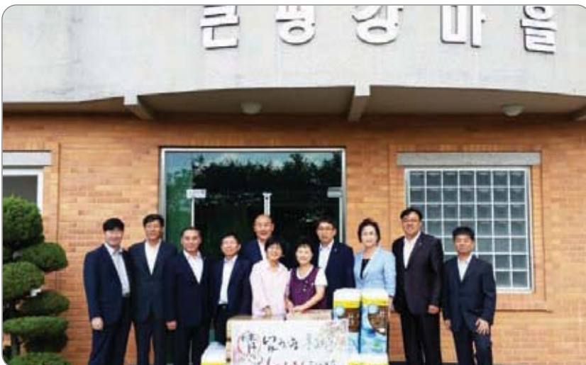
<<< 산업건설위원회 큰평강마을 위문