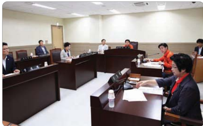
총무위원회 소관 조례안 심의 >>>