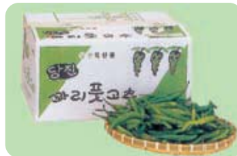
제2미 파리꽃고추 Quar(twisted) Green Pepper 비타민C와 무기질이 풍부