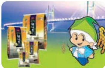
제1미 해나루쌀 Haenaru Rice 해풍 맞고 자란 최고의 브랜드