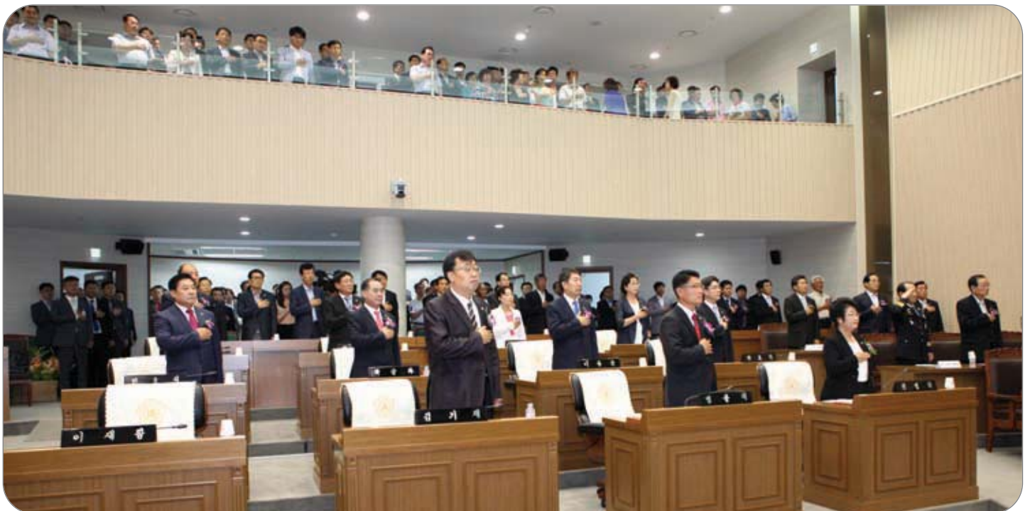
제2대 당진시의회 개원식