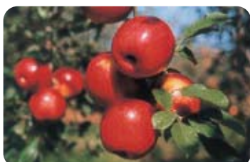
제7미 당진사과 Dangjin Apple 신선하고 당도높은 당진사과